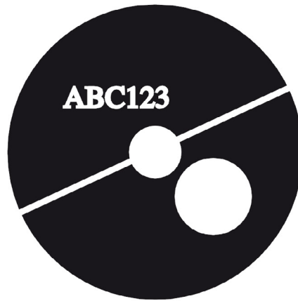
spezieller Weißfilm (übertrieben dargestellt)

Unsere Druckabteilungen drucken ausschließlich nach den farbverbindlichen Proofs, die wir sowohl von den Label- als auch von den Drucksachendaten erstellen.